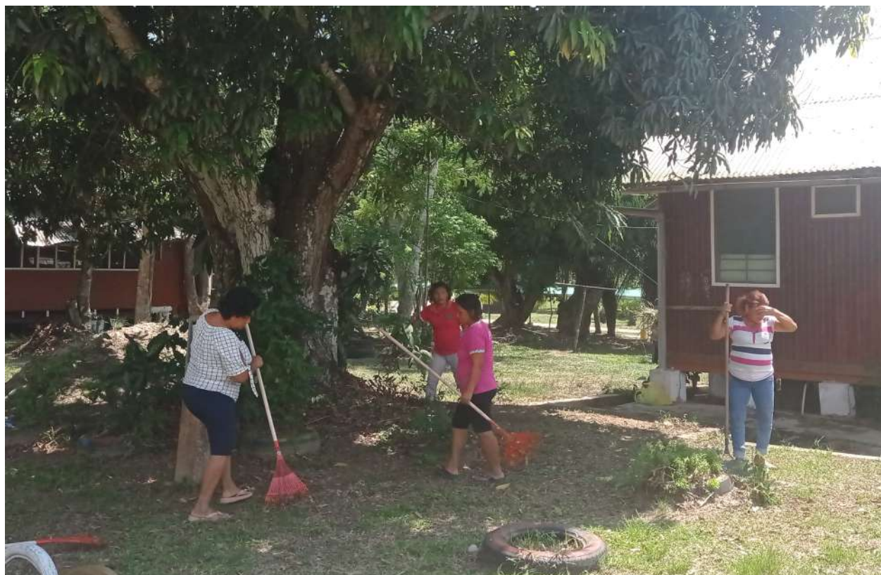
Personal realizando la jornada de limpieza