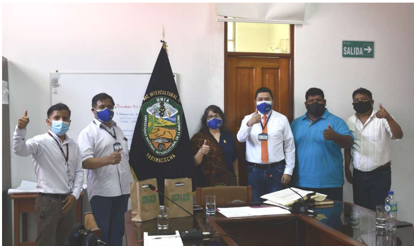
UNIA recibe visita de UNDA