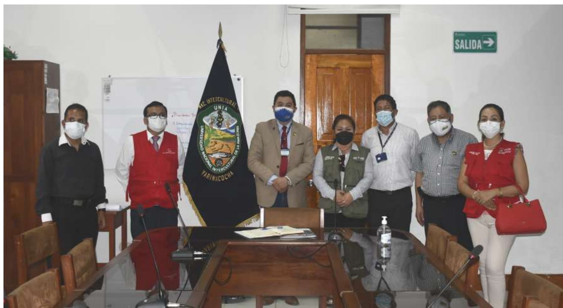
Autoridad UNIA recibe visita de Congresista Francis Paredes y Contraloría General de la República